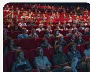
Cines i Teatres