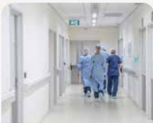
Hospitals i CAPS